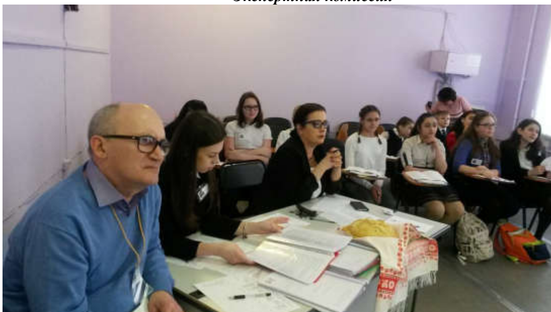
Молодые исследователи – довольные и счастливые!