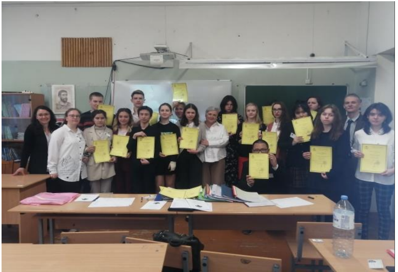
Молодые ученые! довольные и счастливые!