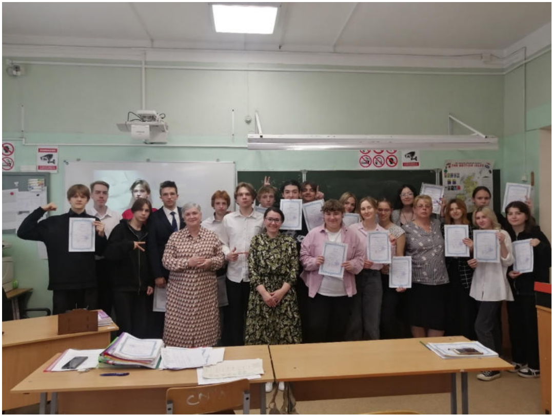
Молодые ученые! довольные и счастливые!