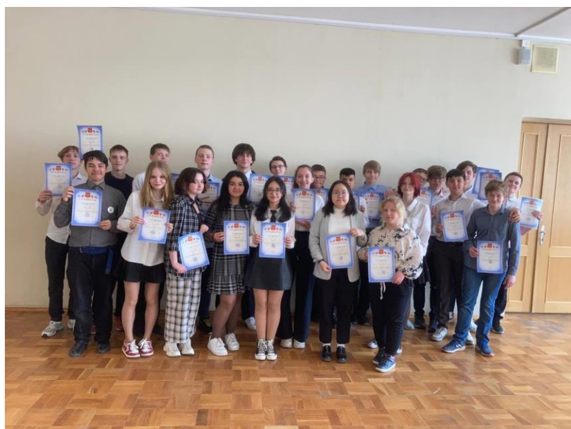
Наука – это интересно!!