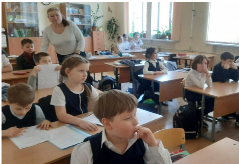
1 а «Купит работа»